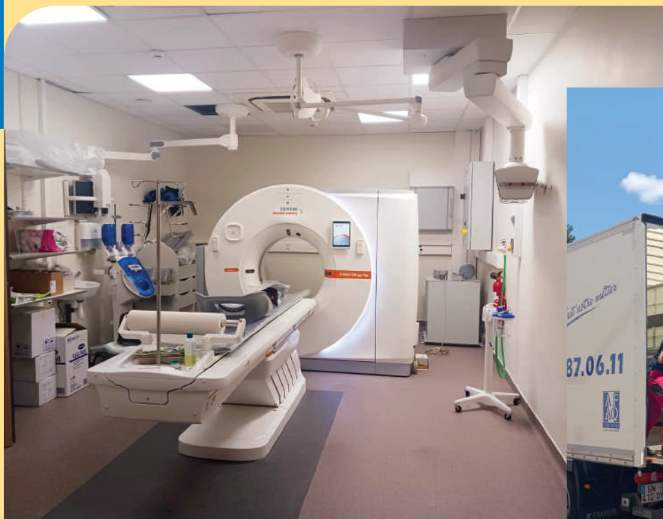
Le nouveau scanner installé