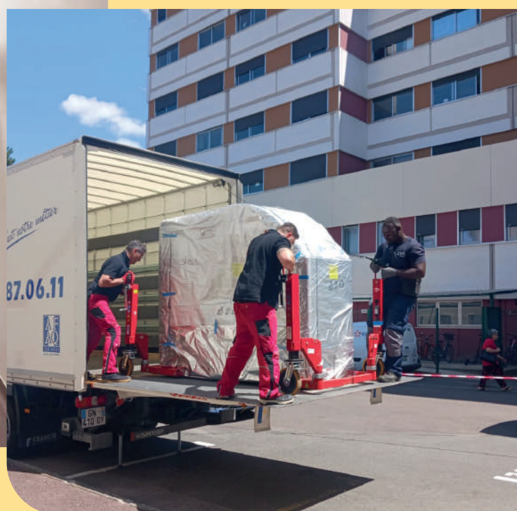
L'arrivée et le déchargement du nouveau scanner