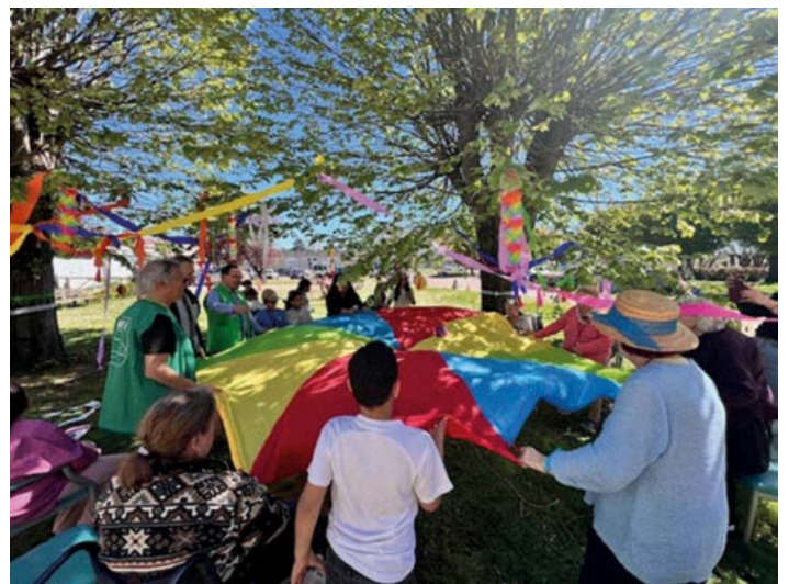
Les équipes animation

Une journée réussie, fidèle à ce qui avait été imaginé, et qui rappelle combien il est essentiel de créer des passerelles entre les générations. Un moment suspendu qui, sans nul doute, restera gravé dans les mémoires de tous les participants.