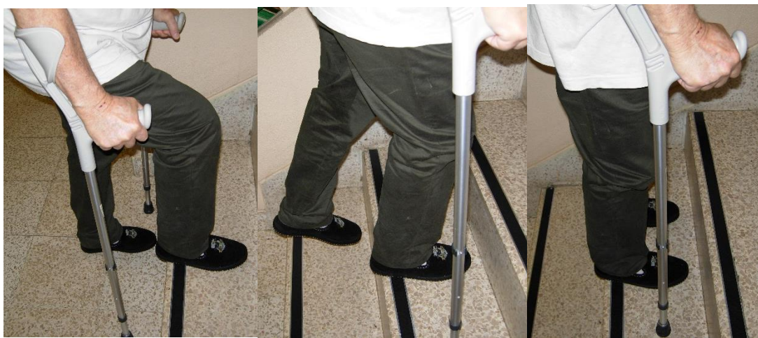
Pour monter l'escalier (de gauche à droite)

Pour monter commencez par la jambe non opérée. Prenez appui sur la rampe ou sur vos cannes. Les cannes accompagnent toujours la jambe opérée. Montez ou descendez une marche à la fois. Amenez les 2 pieds sur la même marche avant d'accéder à la suivante.